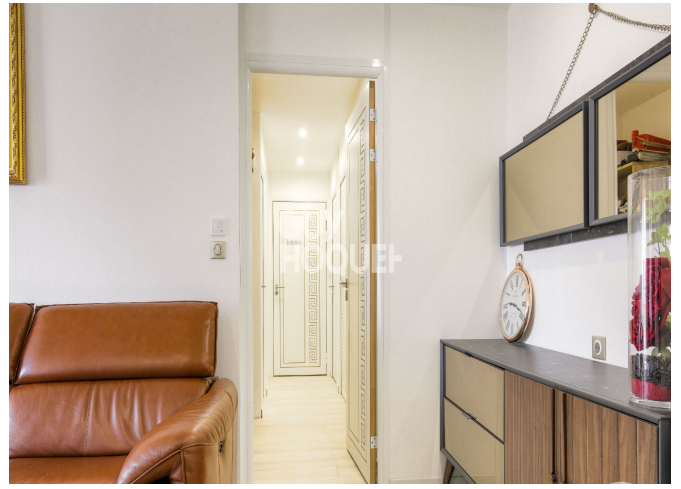
Photo du bien